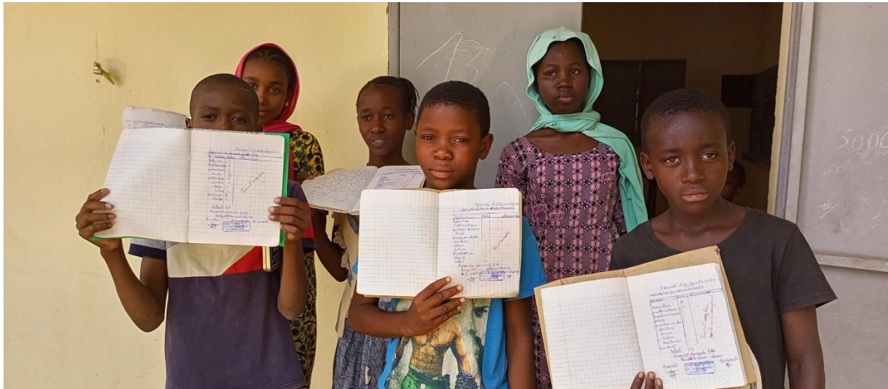
Figure 1 : les enfants transférés du centre de Silma dans l'école de Ousmane Maçinanké de Niafunké de campagne 2019-2020