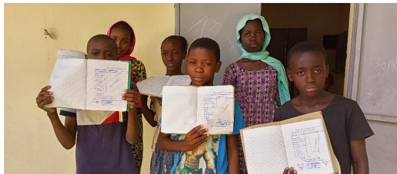
Figure 5 : les 6 meilleurs élèves transférés du centre de Silma à l'école Ousmane Maçinanké