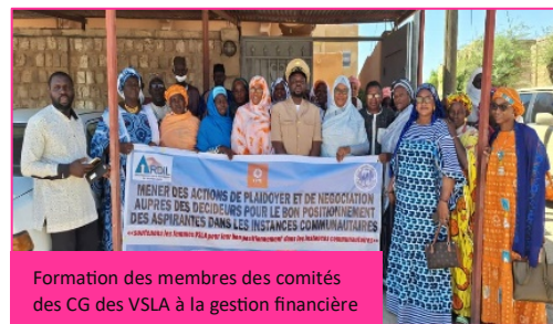
Formation des membres des comités des CG des VSLA à la gestion financière

L'objectif global du programme est d'améliorer l'égalité des sexes pour les femmes et les filles dans 5 régions du Mali dont Tombouctou, les domaines d'impact