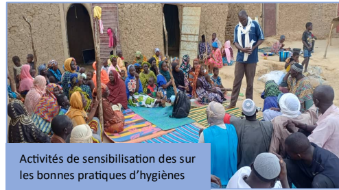
Activités de sensibilisation des sur les bonnes pratiques d'hygiènes

Publics ciblés : ménages, leaders communautaires, écoles.