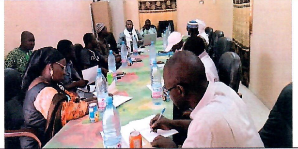
Rencontre d'information des autorités locales par rapport à la méthodologie de ciblage des enfants de 06 à 23 mois et FEFA; mesures barrières ; le nombre prévu par cercle