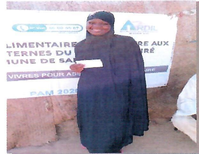
Assistance aux enfants et aux FEFA