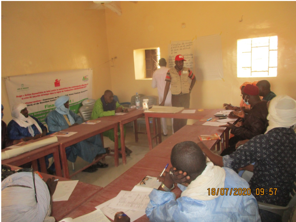
La formation des 20 membres d'ASACO sur la gestion des stocks