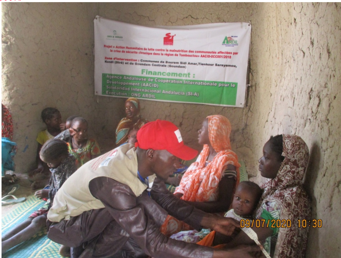
Dépistage des FEFA et enfant à Sinam (Tienkour)