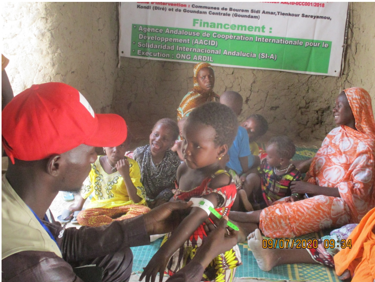
Dépistage des enfants et FEFA dans le village de Sinam