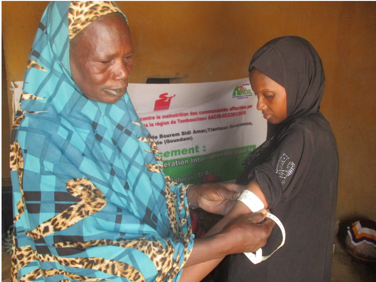
Dépistage des FEFA et enfants dans le village de Siba Ouro Ali par les relais communautaire