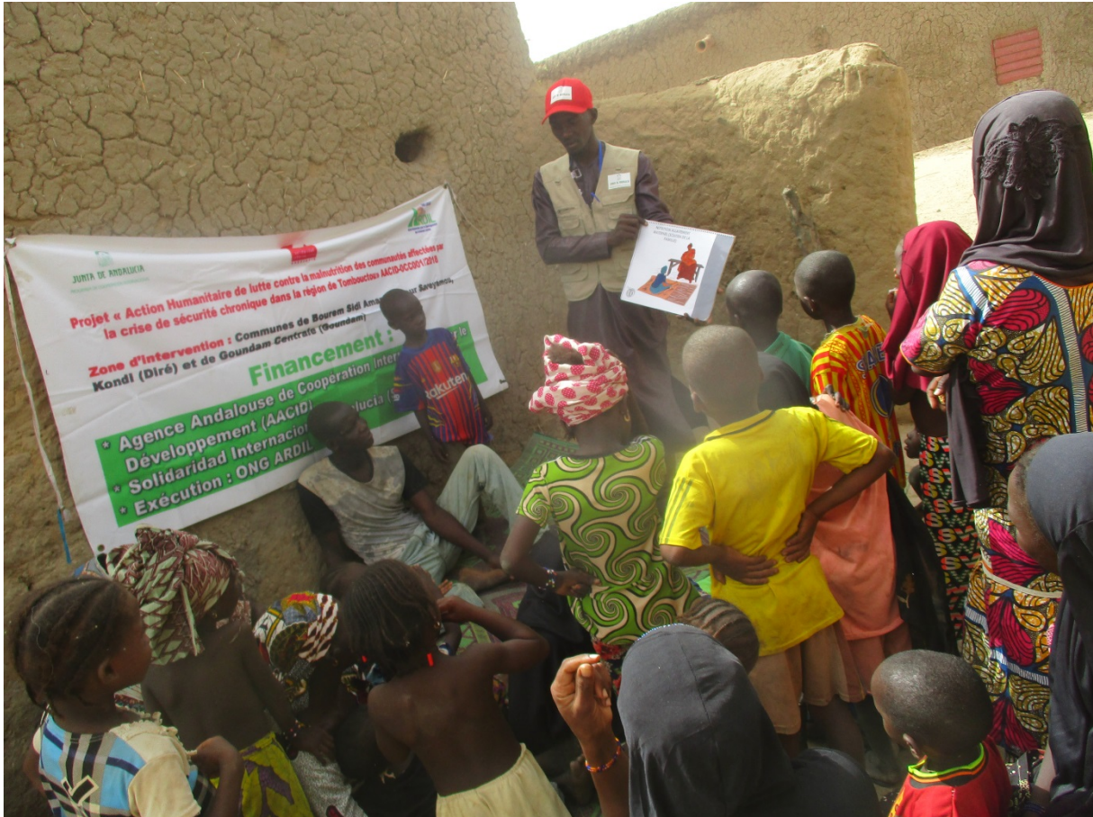
Séance de sensibilisation à Angambango (Bourem Sidi Amar)