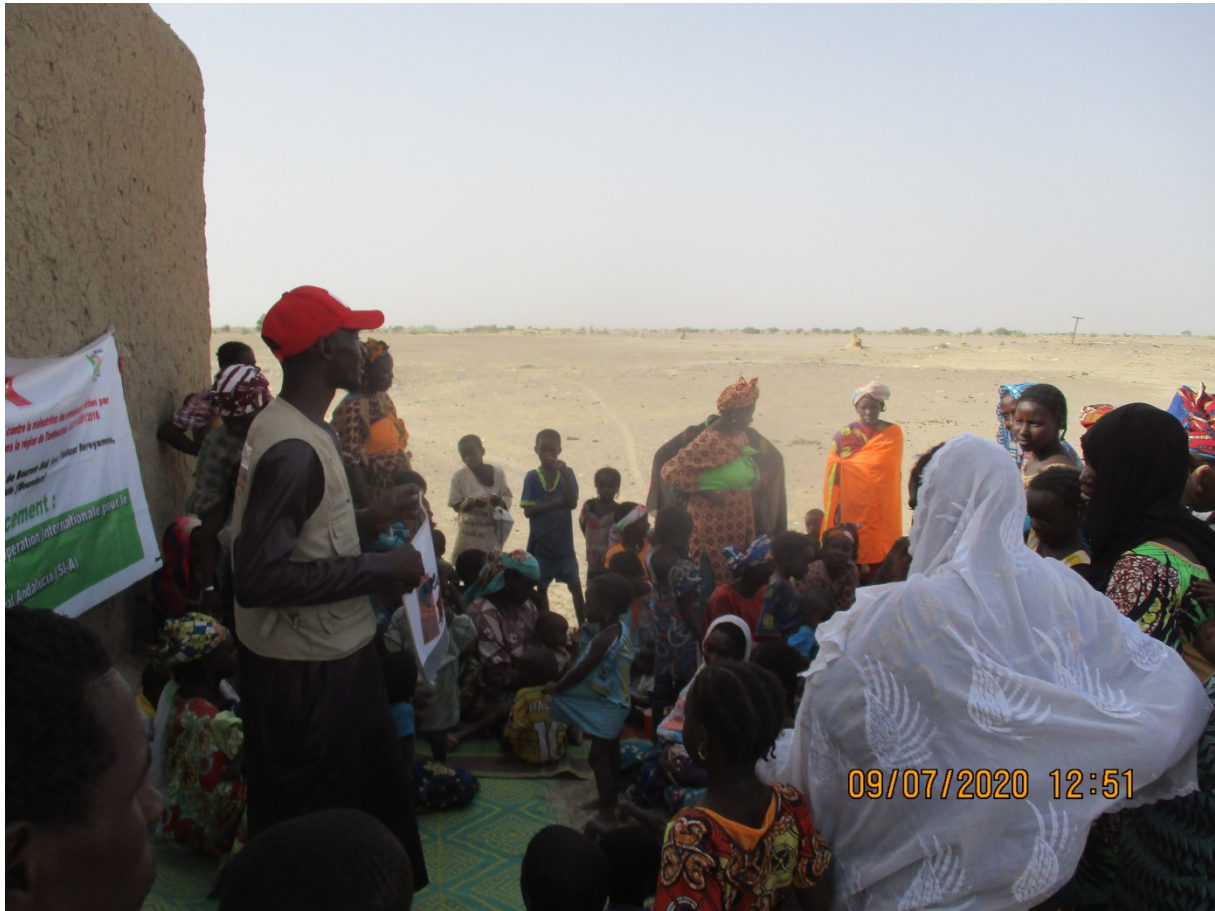
Séance de sensibilisation dans le village de Doukou