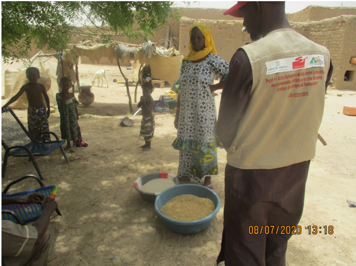
Visite à domicile chez une mère BNF de l'appui socio-économique Chirfiga/Saréyamou