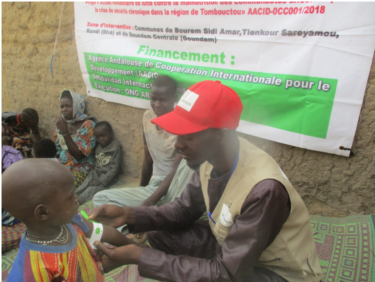
Dépistage des enfants et FEFA dans le village de Gabi Koyra