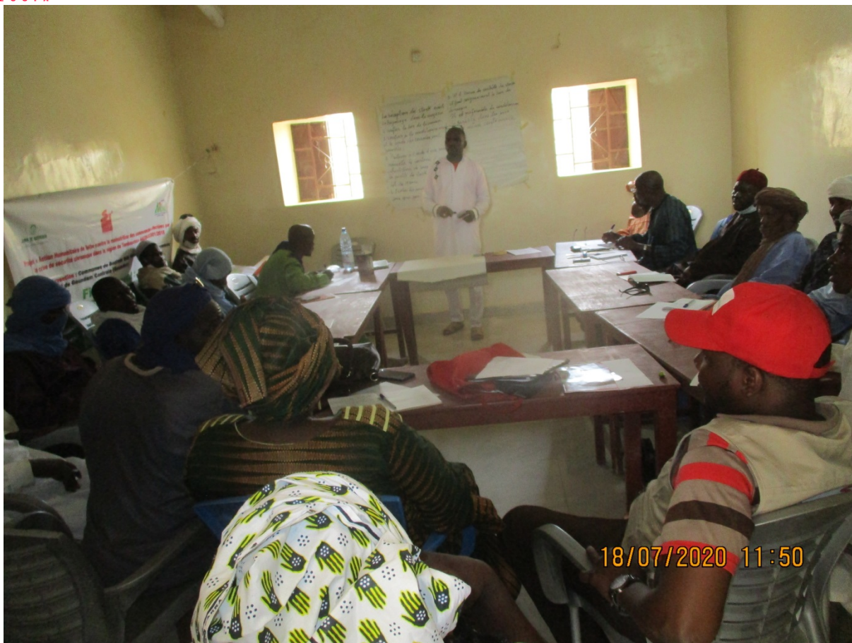
La formation des 20 membres d'ASACO sur la gestion des stocks