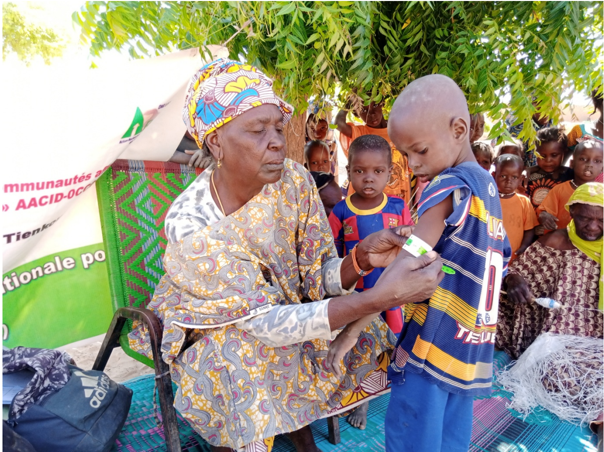
Dépistage des bénéficiaires FEFA et enfants à Hougou-bibi