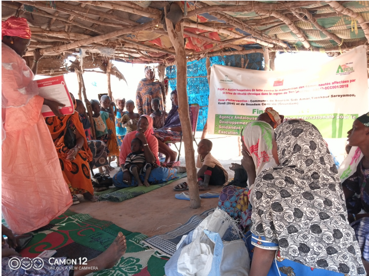
Séance de sensibilisation par le relais et animateurs à Tinafaradj (Goundam Central)