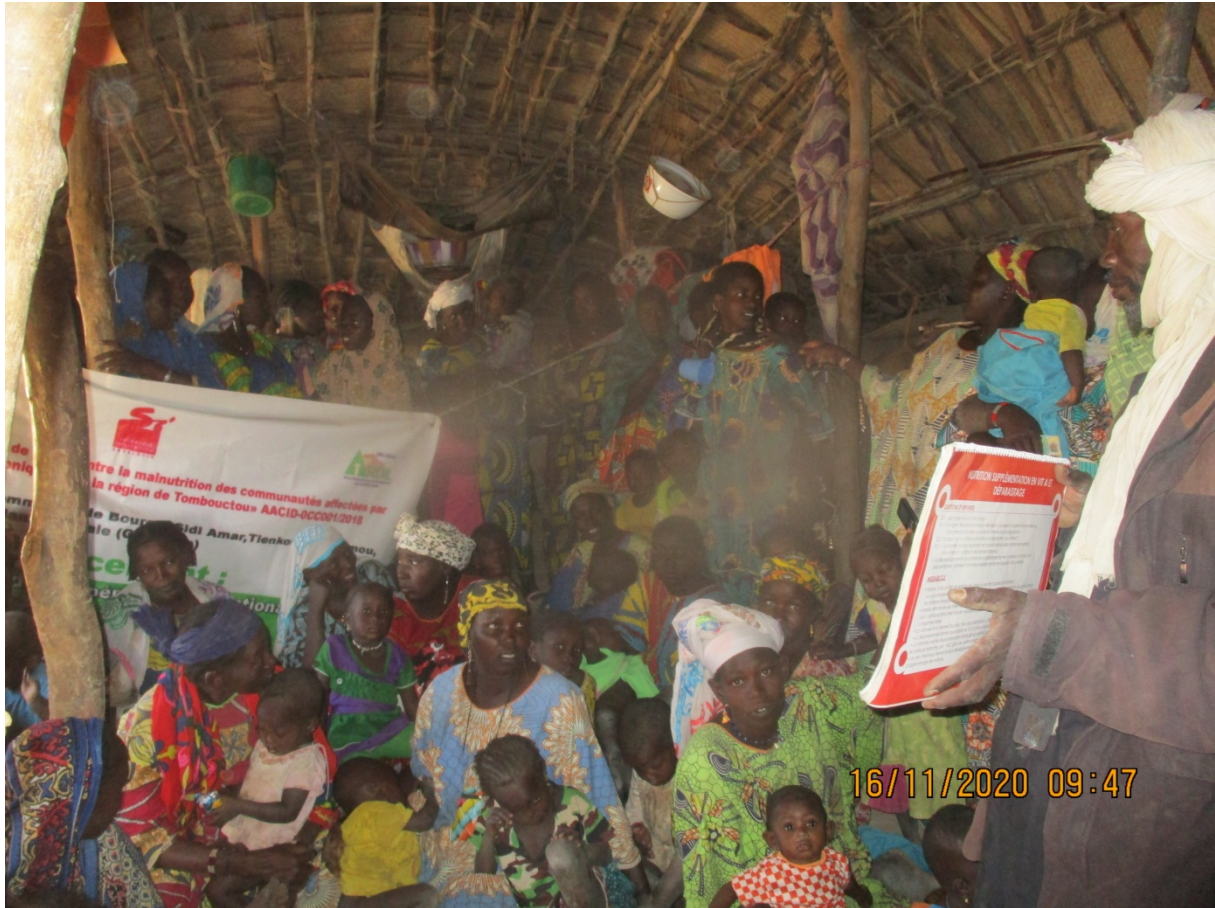
La séance de sensibilisation à Doukou menée par le relais et les animateurs (Commune de Tienkour)