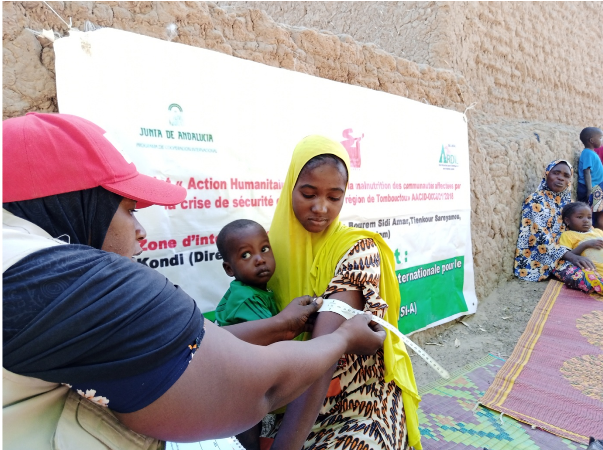
Le dépistage des FEFA et des enfants dans le village de Kondi