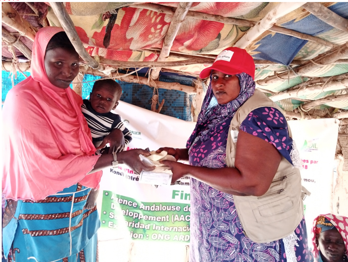
FEFA bénéficiaire du site de déplacés de Tinafaradj(Goundam)