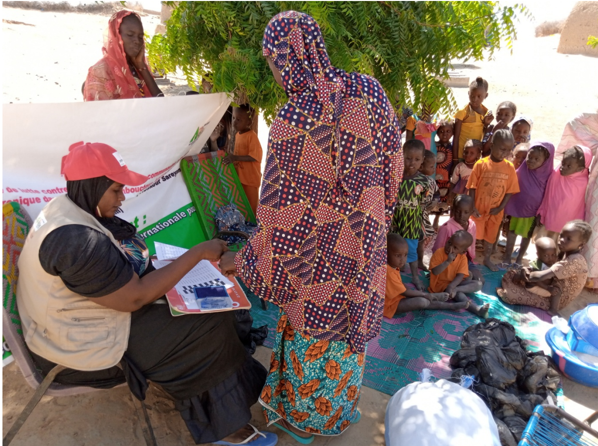
La distribution de paniers alimentaires aux FEFA et enfants bénéficiaires de Hougou-bibi