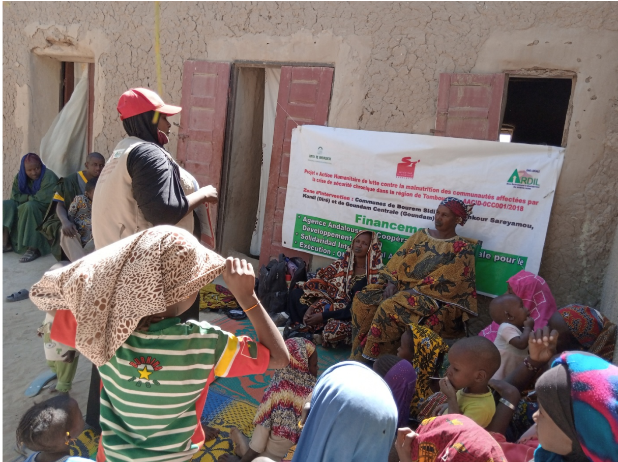
La séance de sensibilisation dans le village de Dialloubé (Commune de KONDI)