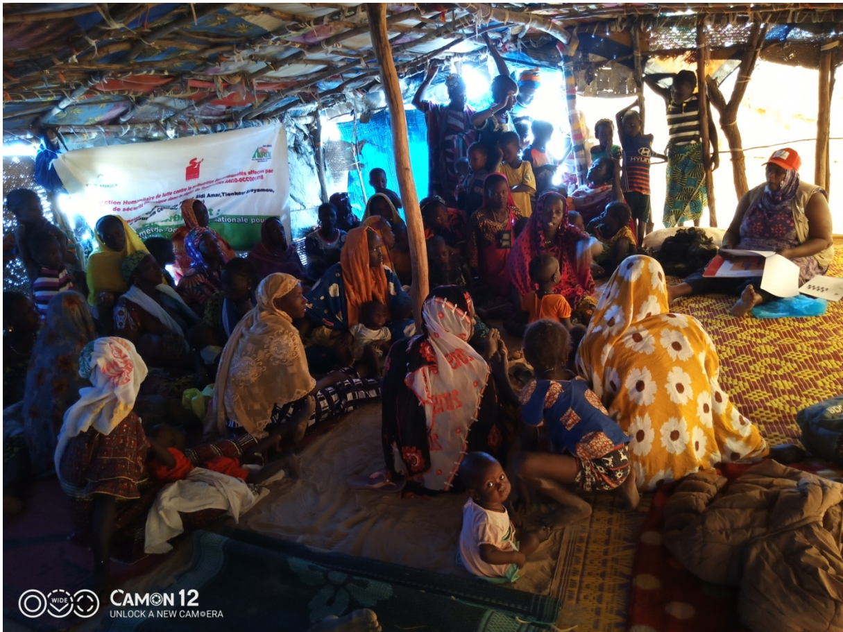
Distribution de paniers alimentaires à Amaganane (Goundam central)