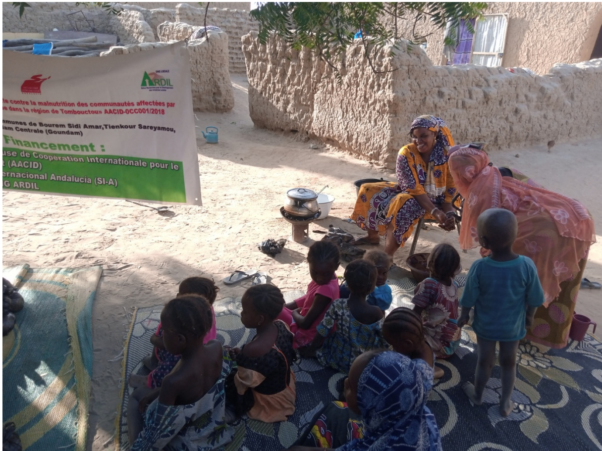
Séance démonstration culinaire dans le village de Yoné par le relais communautaire