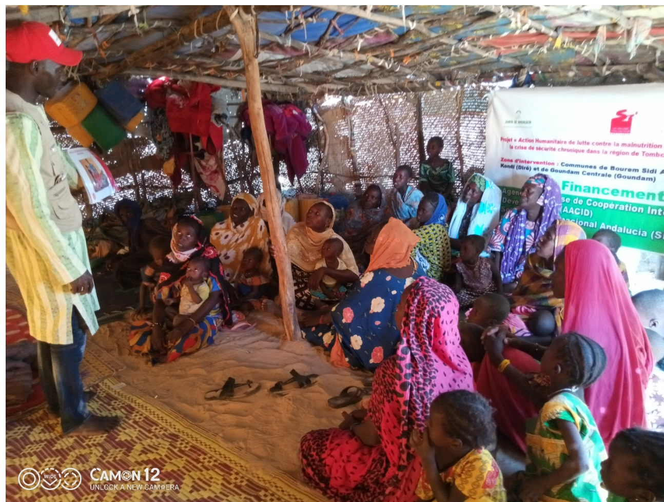
Séance de sensibilisation sur le site de Amaganane (Goundam)