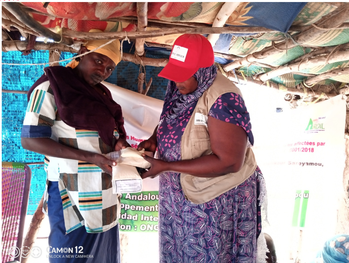
FEFA bénéficiaire du site de déplacés de Tinafaradj(Goundam)