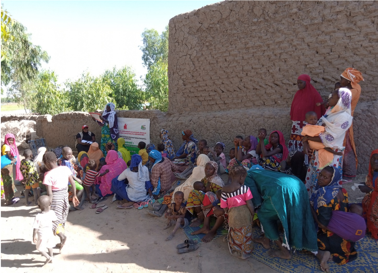
Séance de sensibilisation à Kondi