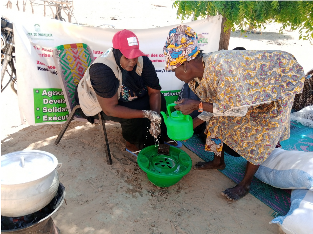
Lavage des mains au savon avant le début de séance de sensibilisation à Hougou-Bibi (Kondi)