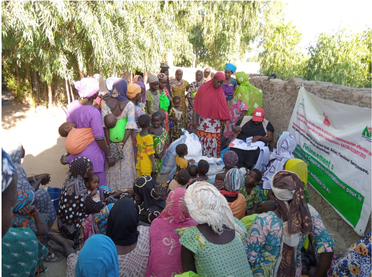
Distribution de paniers alimentaires à kondi