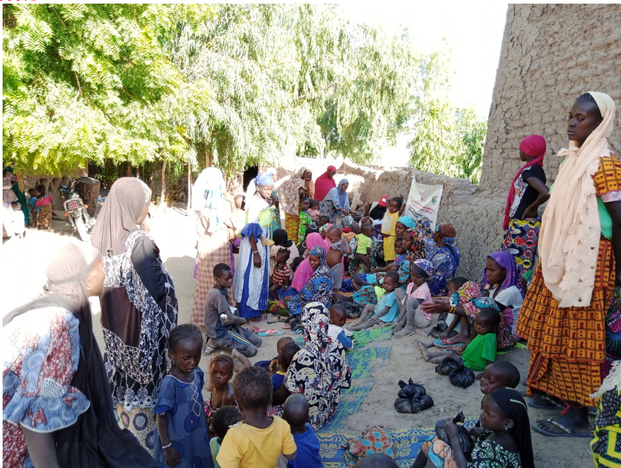
Séance de sensibilisation à Kondi