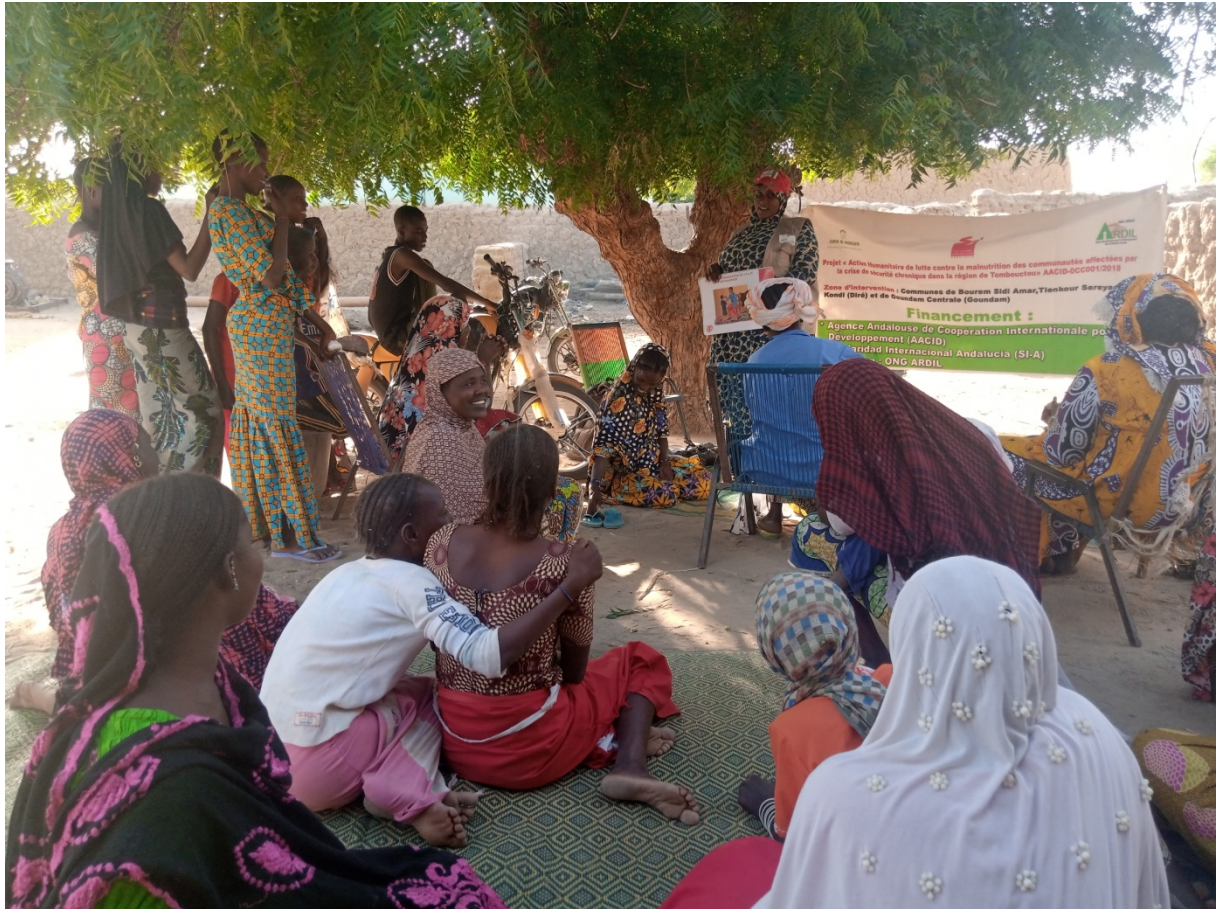
Séance de Sensibilisation à Yoné (Tienkour)