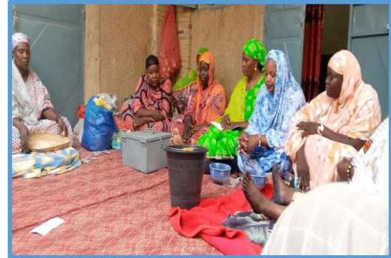
Suivi AVEC à Alphahou de Goundam