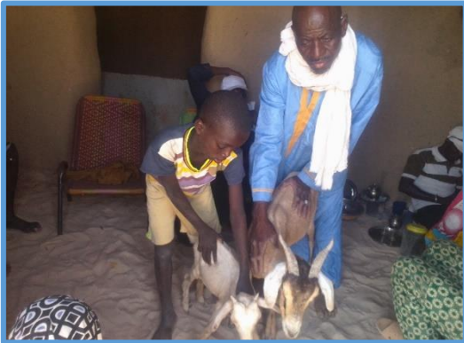
Suivi cheptel à Toufazrouf

Quelques images des activités du mois d'Avril 2022