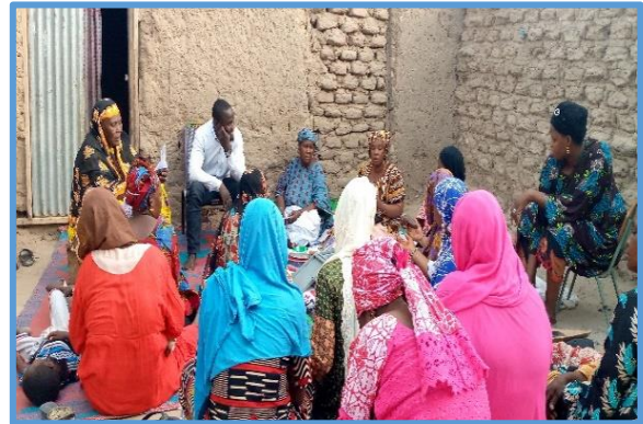
Suivi AVEC à Goundam Radjirata