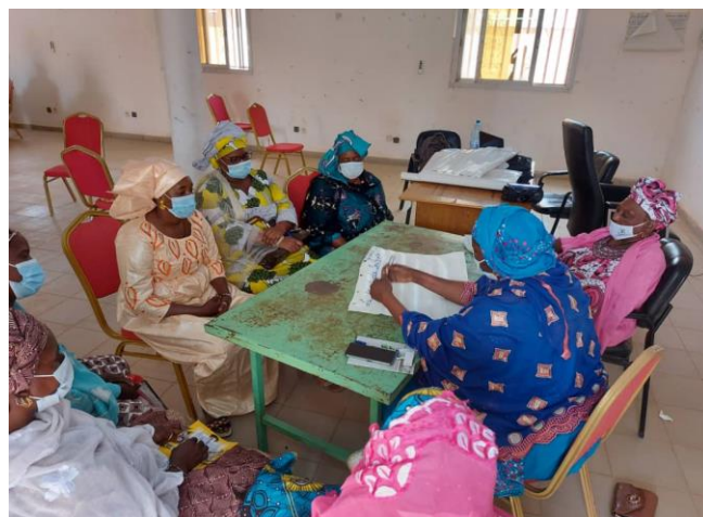
Atelier de formation sur la justice transitionnelle à Goundam