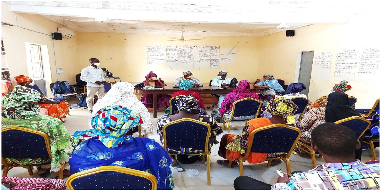
Le Maire de la commune urbaine de Diré à l'ouverture de l'atelier