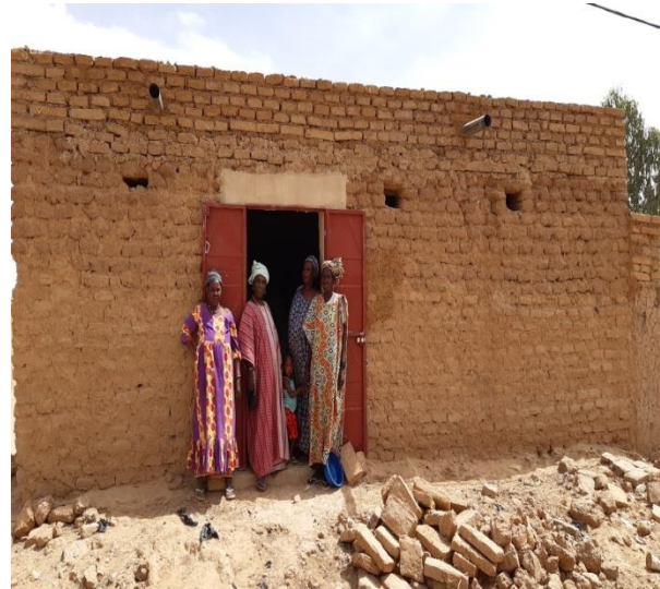
Banque de céréales construite sur fonds propre par le réseau Medine