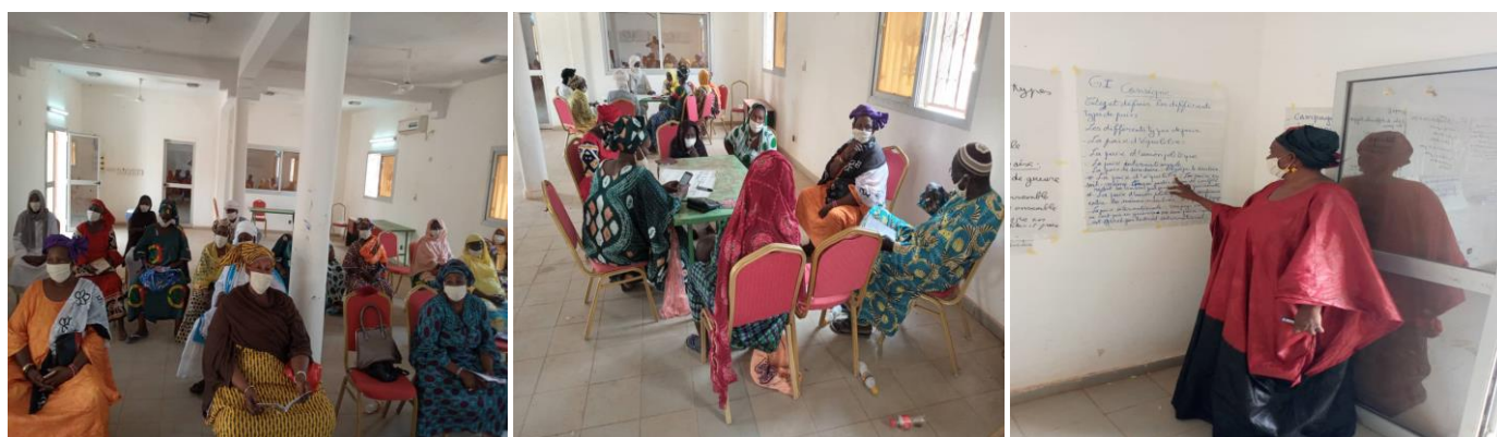
Atelier de renforcement de capacités pour le plaidoyer auprès des partenaires