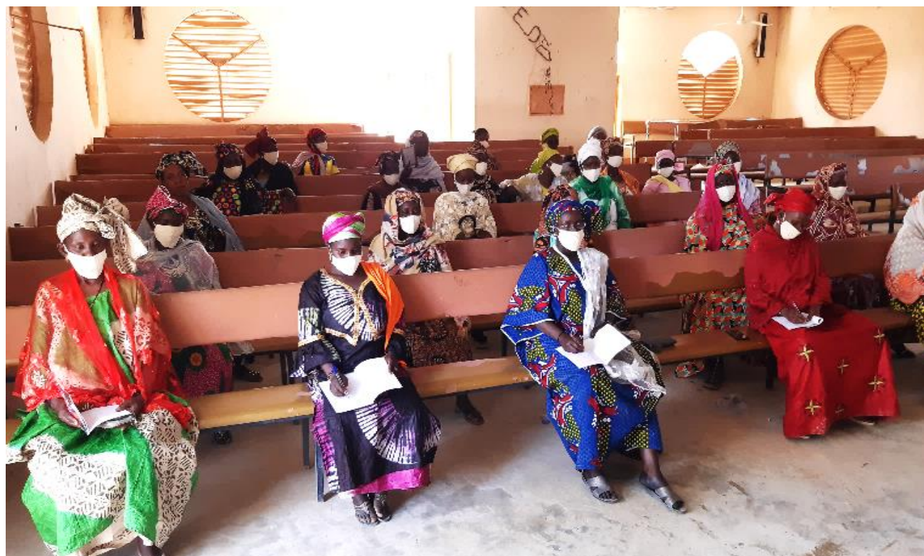
Tableau n°005 : Situation des femmes renforcées sur les principes de gouvernance