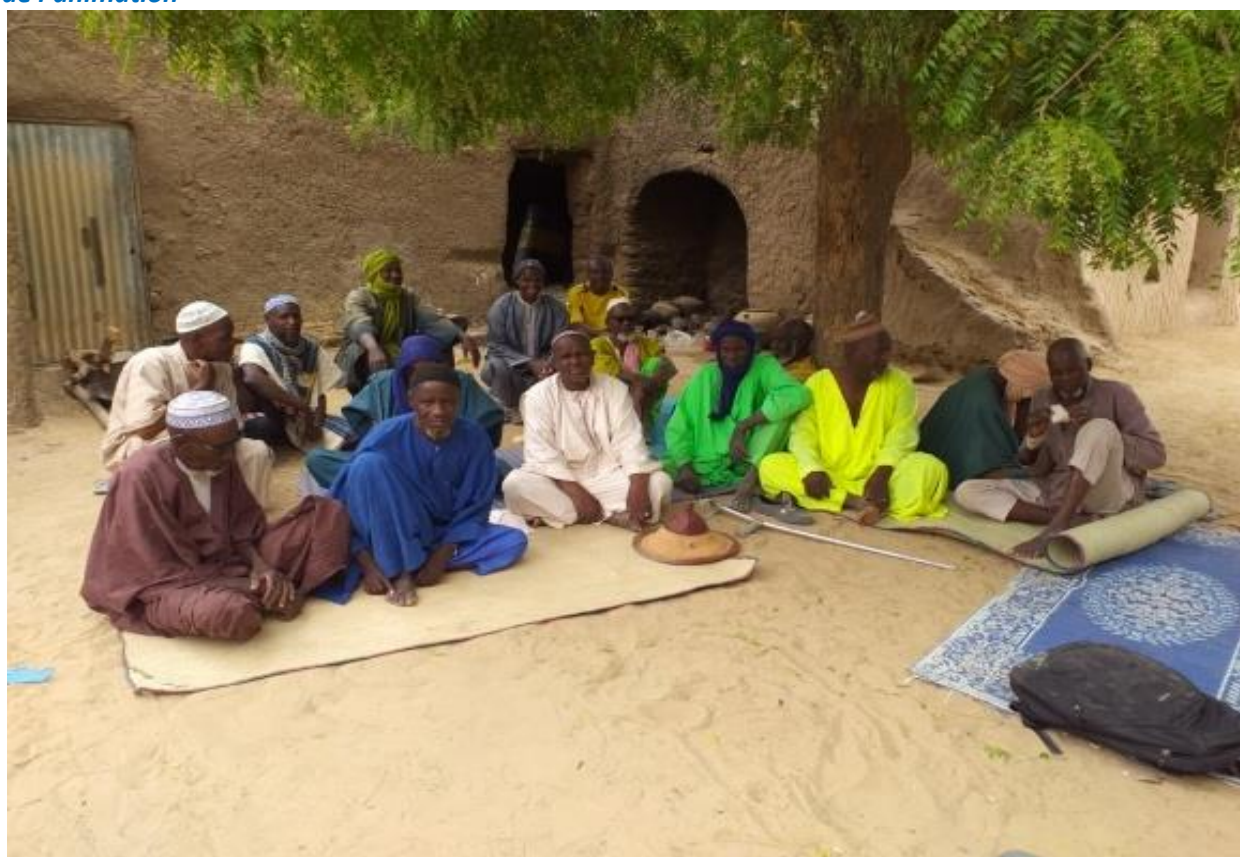
Animation des hommes de Tarfa