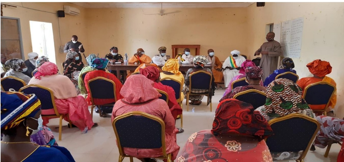
Participants à l'atelier de plaidoyer

Remettre la lettre de plaidoyer aux autorités administratives