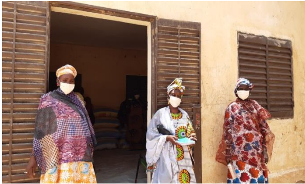
de céréales du réseau Kourmina de Tindirma