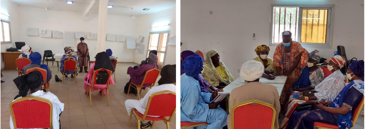
Atelier pour la mise en place un mécanisme de suivi et d'évaluation du plan de plaidoyer au niveau local à Goundam