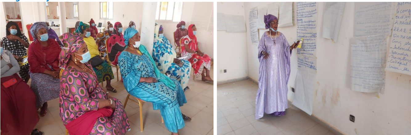
Atelier de formation sur le développement du leadership féminin et aux programmes de talents