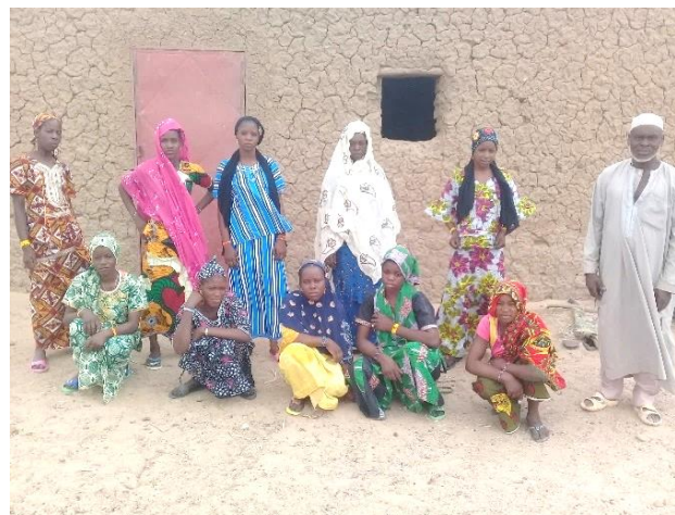
Cercles d'amis à Tassimane à gauche et Soudoubé à droite