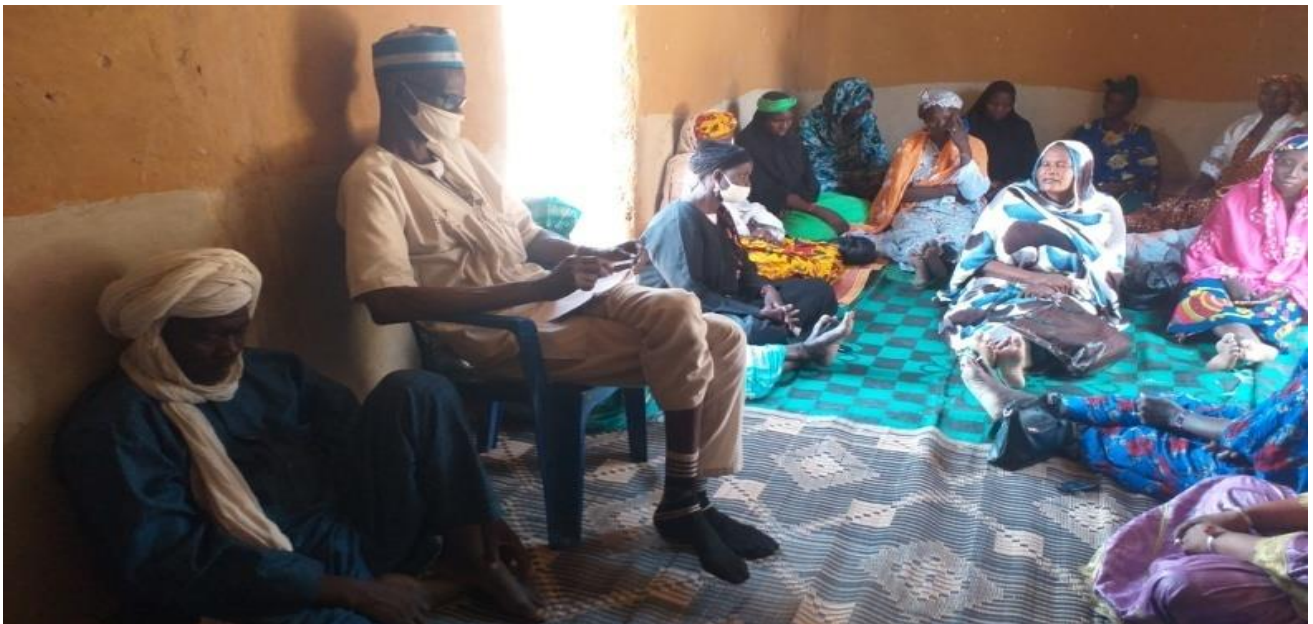
La conduite de l'action de plaidoyer.