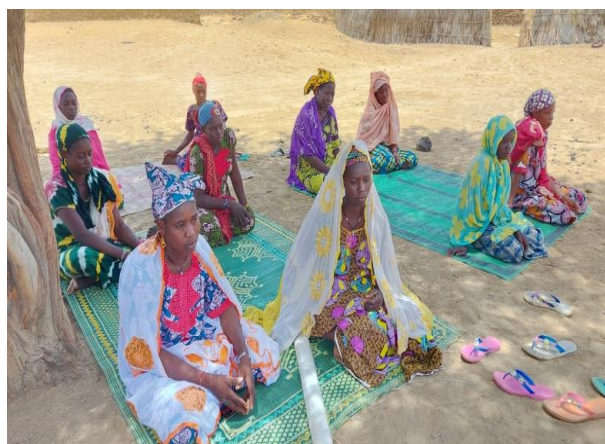
Mise en place de cercle d'amis à Dendedjère