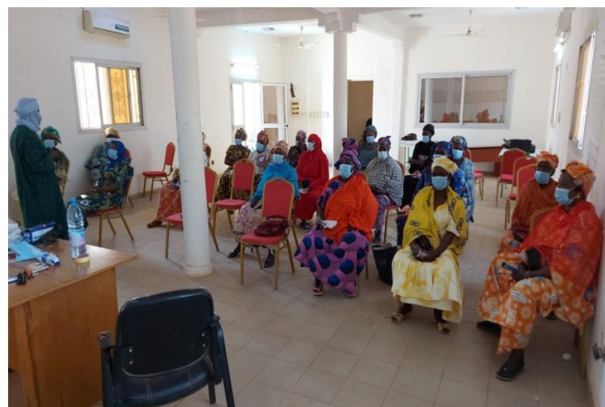
Atelier de formation sur la gestion financière à Goundam