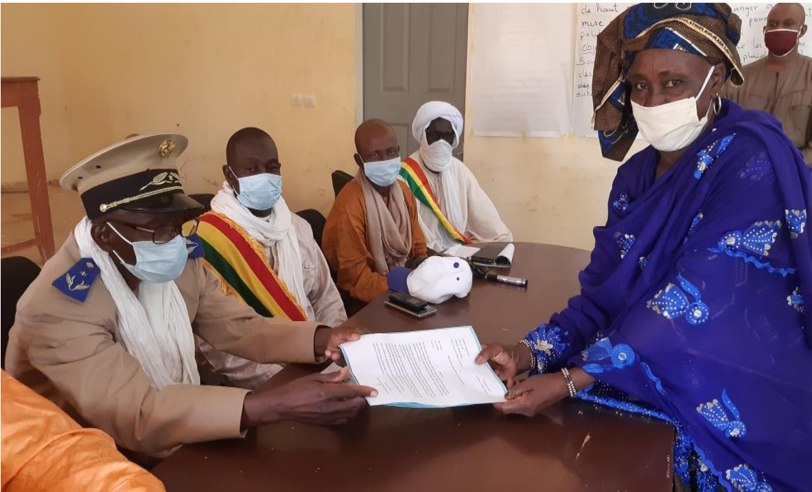
La séance de remise de la lettre de plaidoyer par la présidente du réseau cercle de Dire au préfet

Cette activité a été suivie par la lecture de lettre de plaidoyer par la présidente du réseau cercle de Dire et de la remise de la lettre de plaidoyer au préfet du cercle de Dire par les femmes