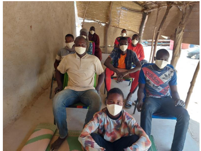
Mise des coalitions communales des champions hommes et garçons à Télé et à Dangha