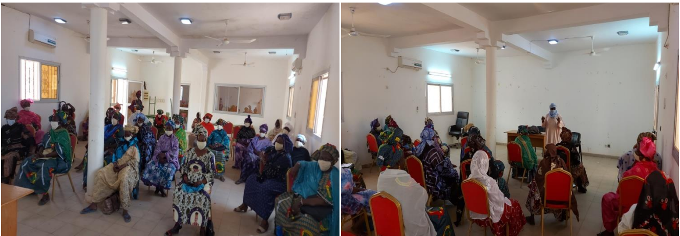
Atelier de formation sur des activités de promotion des droits civiques et politiques des femmes à Goundam

30 femmes ont pris part à cette formation tenue à Goundam.