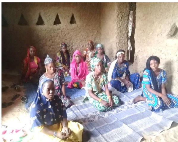
Séances d'animation des filles des cercles d'amis à Godjé et Kongoudiara

Courant ce semestre, treize (13) séances d'animation ont été conduites auprès de huit (8) cercles d'amis mis en place au mois de Mai. Le thème de ces animations a porté sur le leadership féminin. Au total 228 filles membres des cercles d'amis ont participés à ces séances d'animation. Ces rencontres ont été d'une grande satisfaction pour les filles qui se disent mieux outiller par rapport au thème VBG