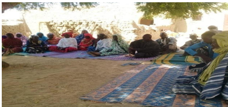
Tableau n°030 : Situation des comités VBG mis en place