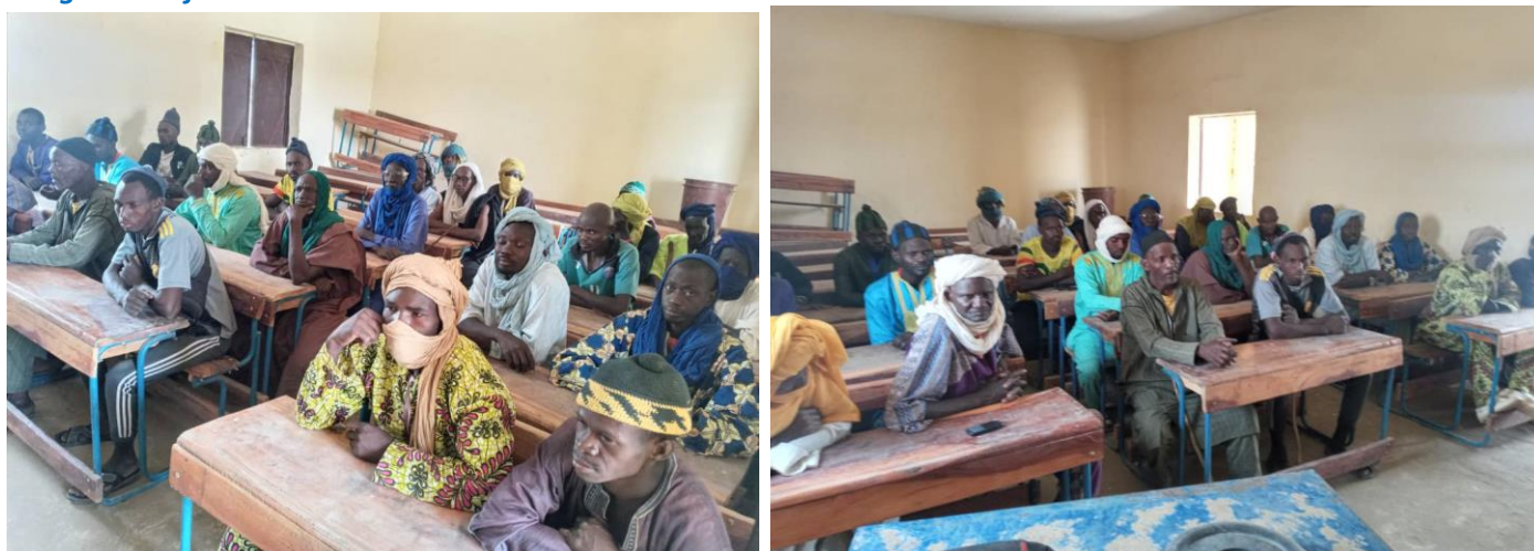
Formation des agents villageois de la commune de Télé