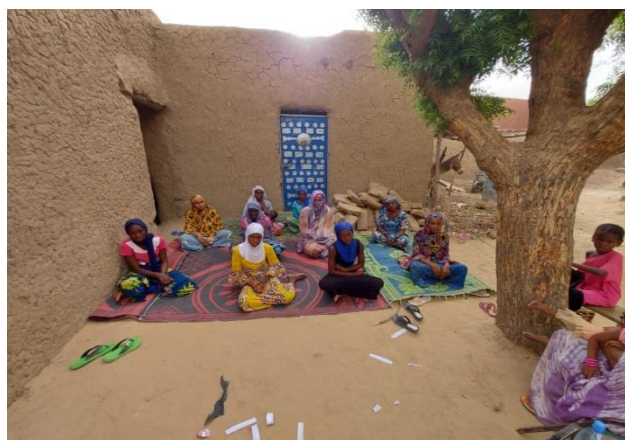
Mise en place de cercle d'amis à Faridjéno