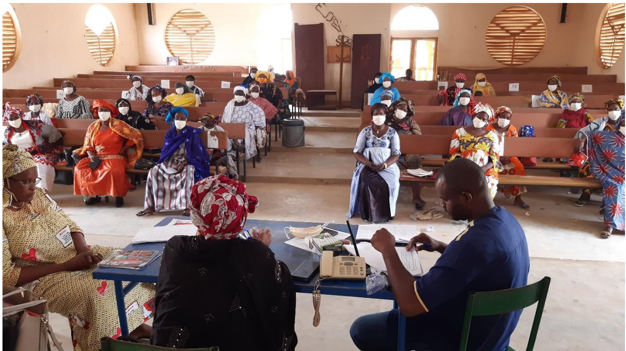
Madame la responsable du service local de la promotion femme, de l'enfant et de la famille en appui lors de l'atelier de formation