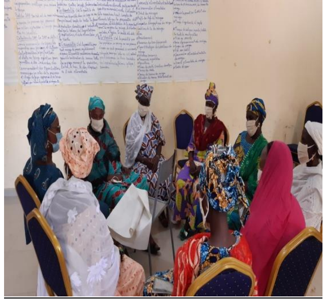
Participants en travaux de groupes