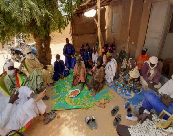
Espace d'interpellation au niveau du village de