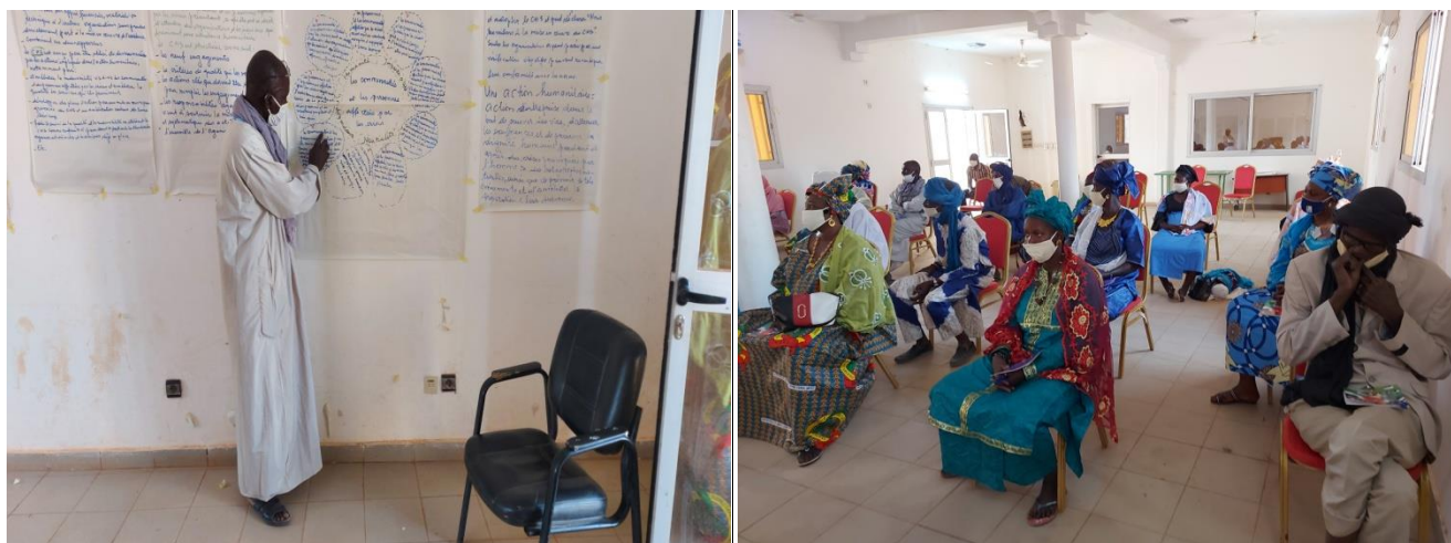
Atelier de formation sur les principes humanitaires à Goundam