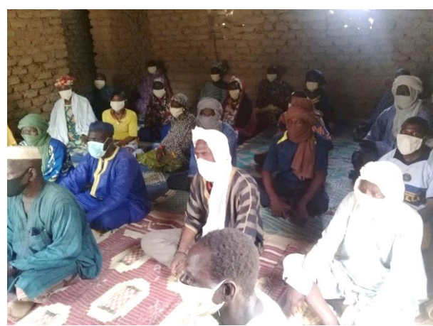
Le comité VBG de Balamodé