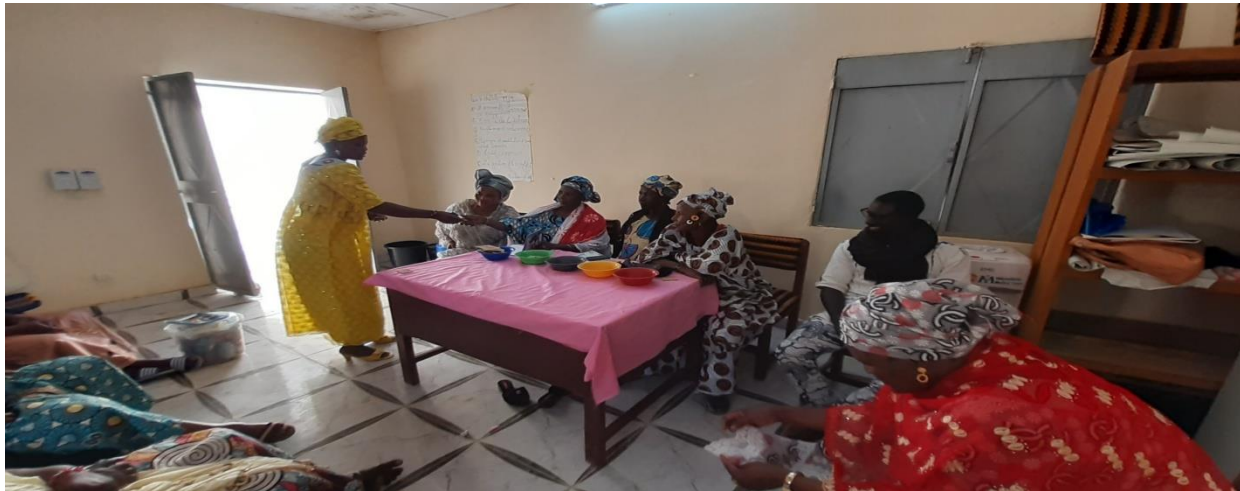
Simulation de collecte d'épargne