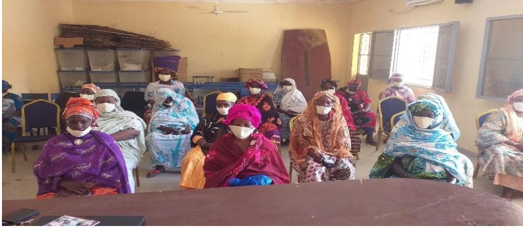
Participants à l'atelier de formation