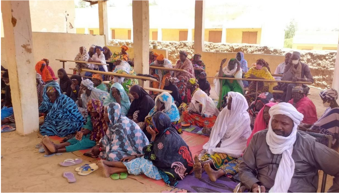
Participants l'atelier de restitution du contenu du plan

Objectif général : Mettre en œuvre les activités du plan de plaidoyer