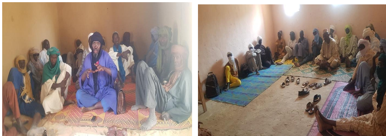
Participants aux ateliers de formation des communes d'Arham à droite et de Kirchamba à gauche

☞ Soutenir les coalitions de champions hommes / garçons