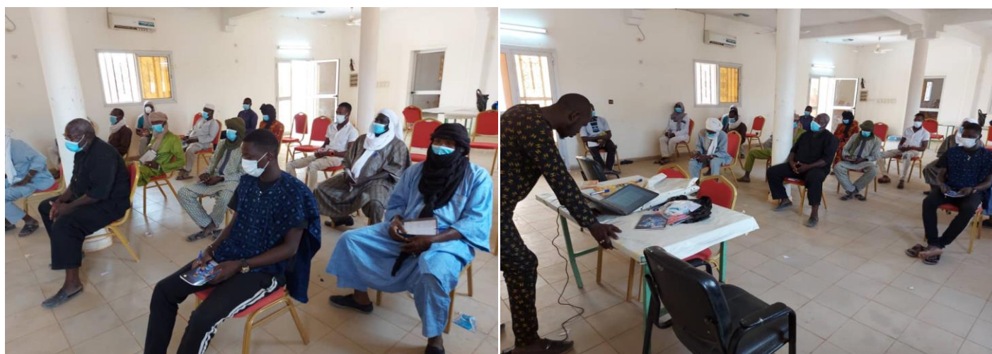
Atelier de formation des chefs religieux, des chefs de communauté, des communicateurs traditionnels sur la masculinité saine et positive à Goundam