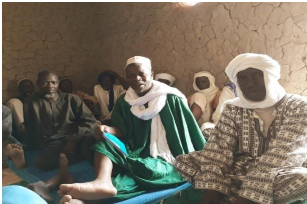
Formation des hommes du village de Sinem commune Tienkour