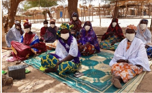
Rencontre avec le comité de gestion de la banque dee indirma