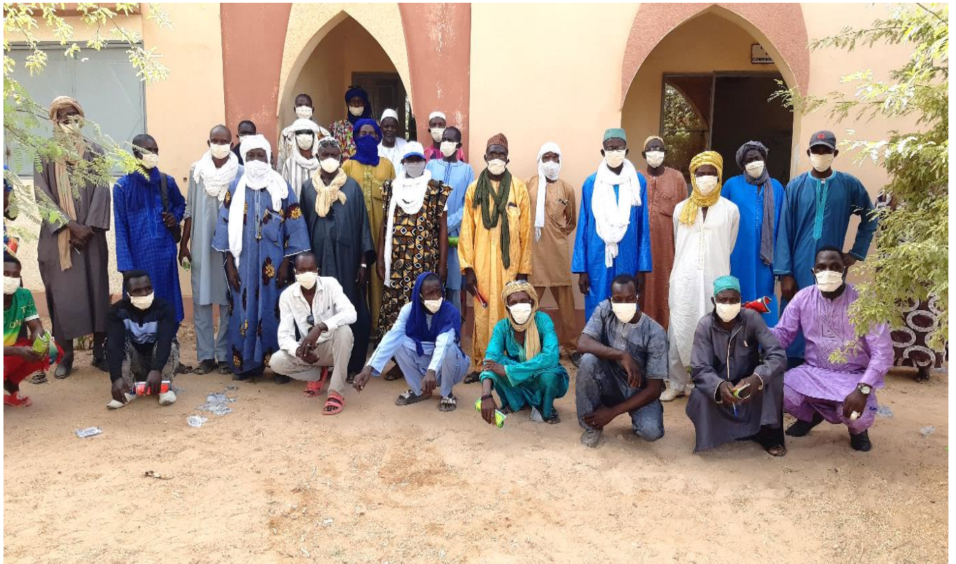
Photo de familles des hommes engagés à l'atelier