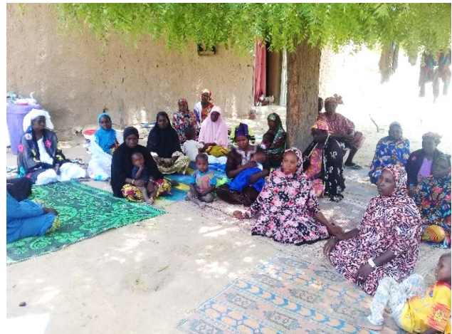
Mise en place du Réseau villageois de korongoiberi