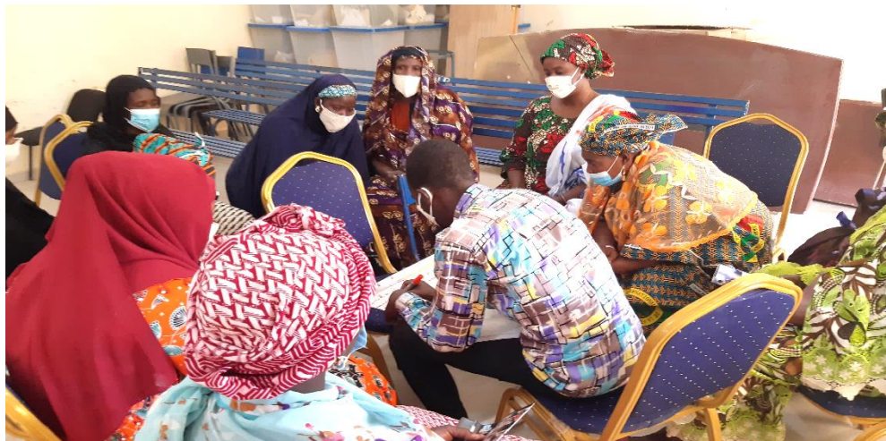
Participants en travaux de groupes

Il est a noté que l'alliance a été baptisé MARA NDA YERKOY et deux organes ont été mis en place : un comité de gestion de onze (11) membres et une commission de suivi du plan de cinq (5) membres. Les noms, postes et organisation de provenance des membres des organes sont dans le rapport d'activité de l'atelier