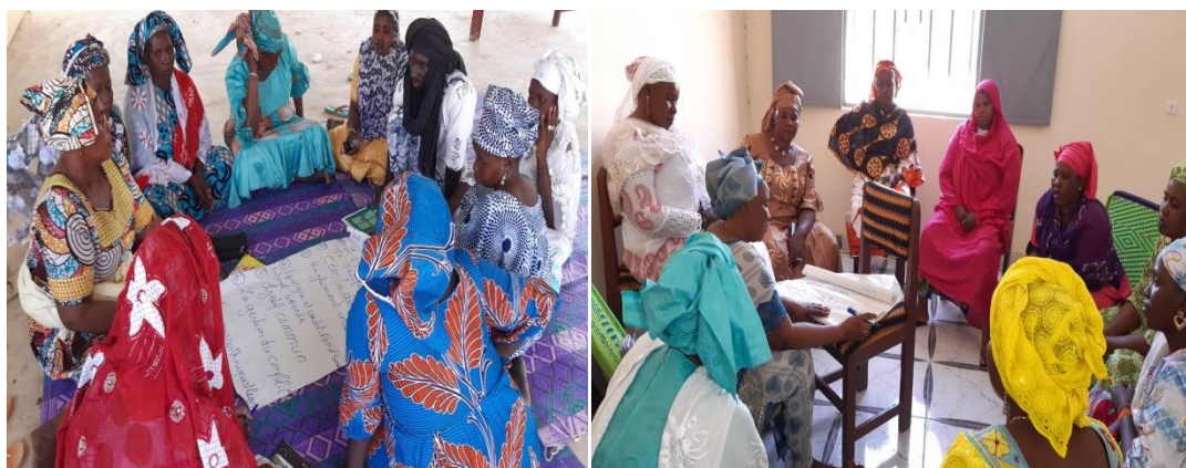
Participants en travaux de groupes