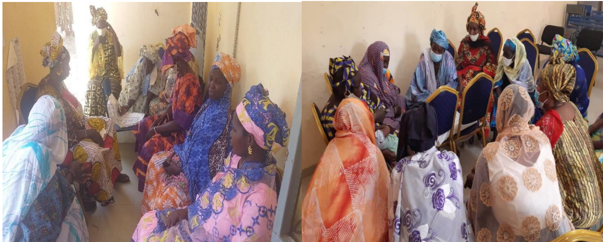
Participants en travaux de groupes