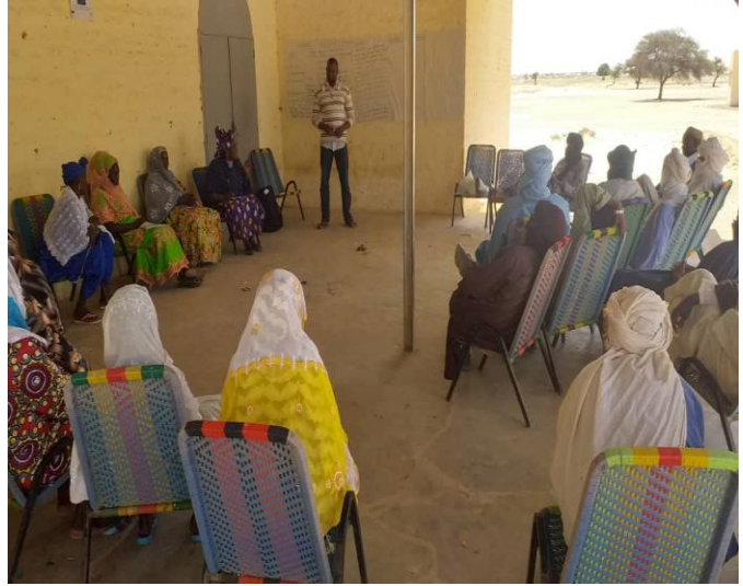
Espace d'interpellation à Banikane