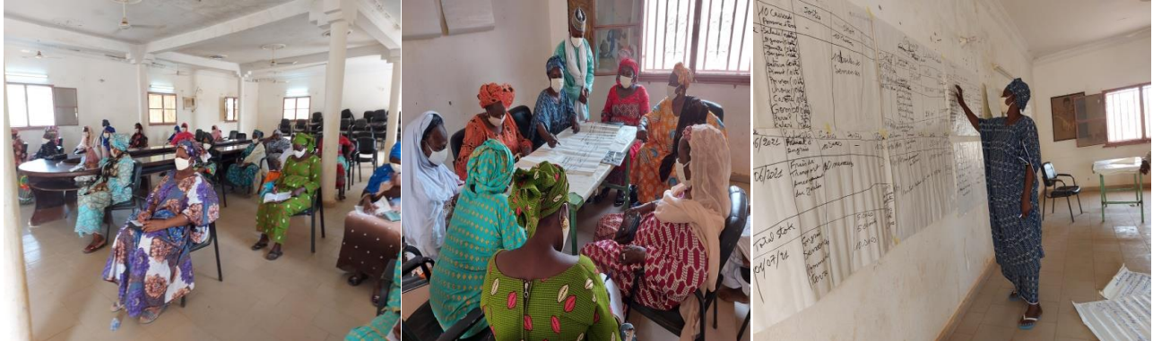
Atelier soutenir les micro-entreprises femmes et hommes dans de nouveaux domaines prometteurs