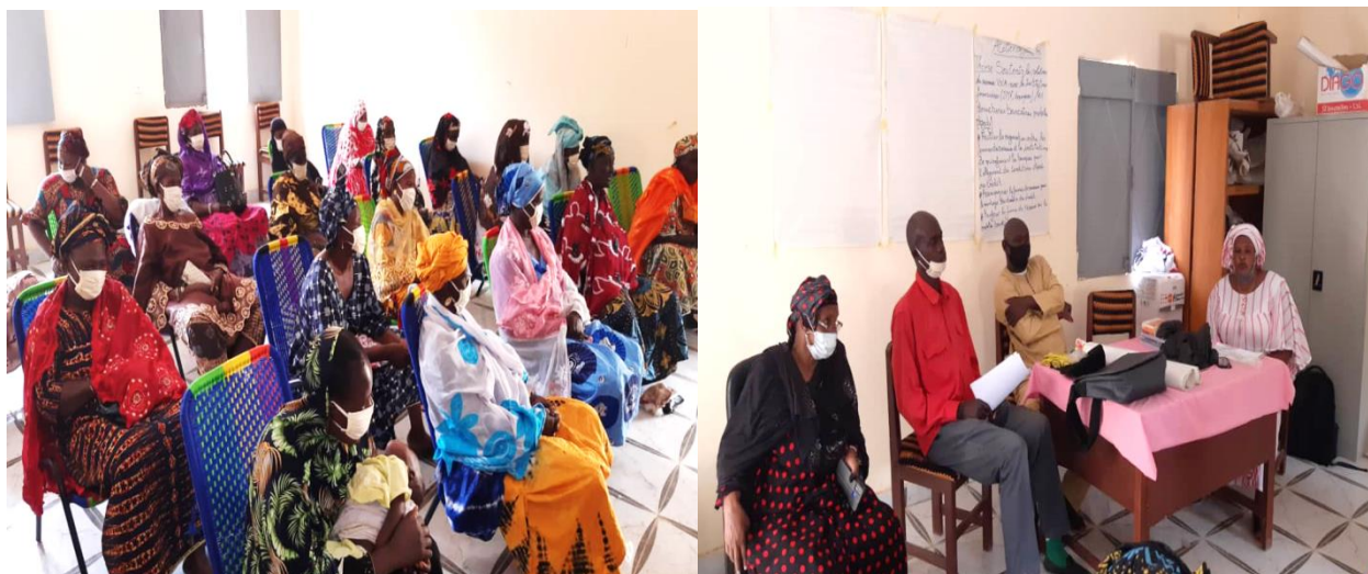
Participantes et les représentants des IMFs Tchilifinance et CAMEC à l'atelier