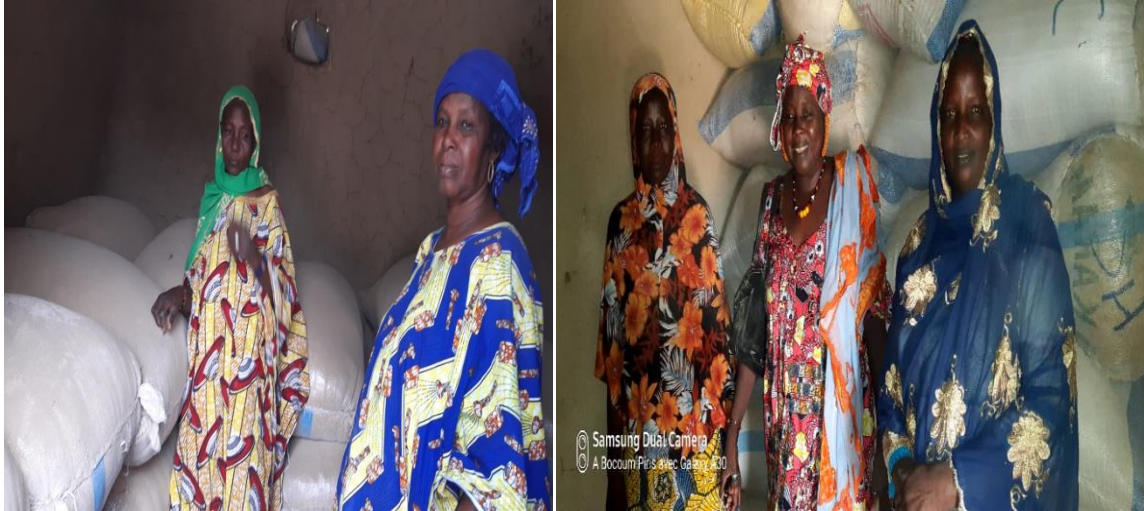
Banques de céréales des villages de Koundar et Minessingué