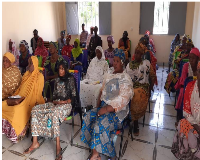
Ouverture de l'atelier de la formation par le Maire