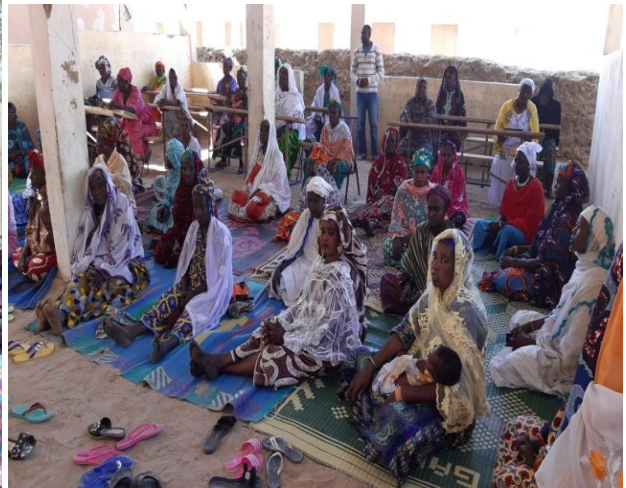
Mise en place réseau villageois de Haibongo