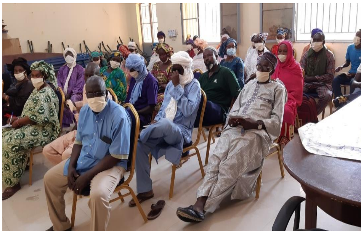
Image de la formation

Méthodologie : la méthode utilisée a été les travaux de groupes, le brainstorming et les témoignages,