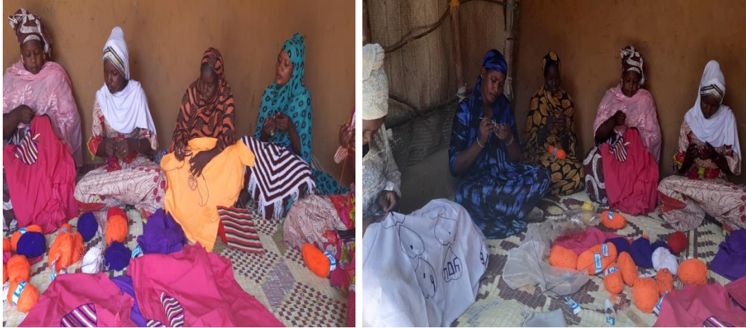
Les filles du PJT Djinekoy en activité de tricotage