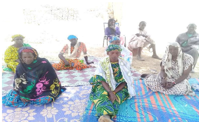
Séances d'animation à Fongo Manacou