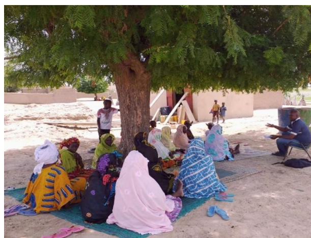
Image de la formation

L'objectif visé est d'améliorer les capacités en marketing, gestion et accès aux marchés des femmes qui mènent des activités génératrices de revenus.