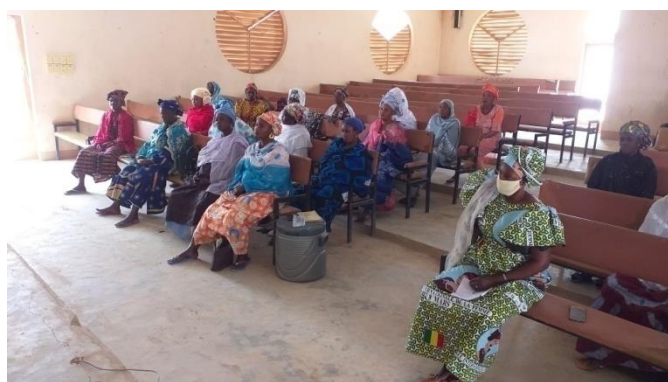
Tableau n°... : Situation des participants aux sessions de renforcement des capacités des partenaires