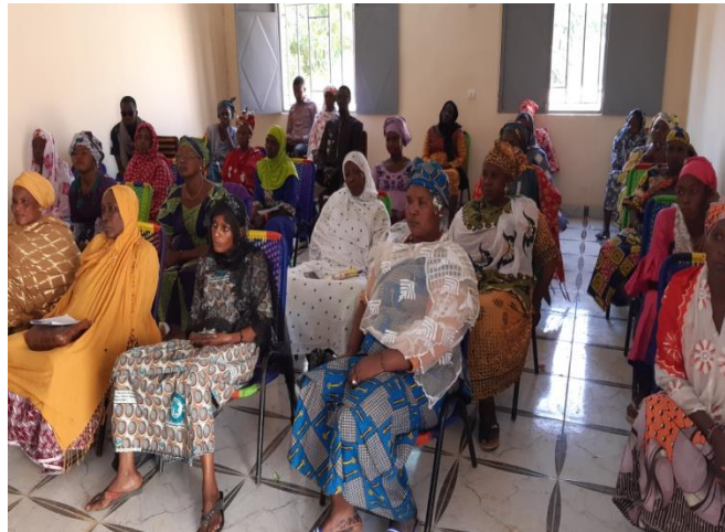
Ouverture de l'atelier de la formation par le Maire