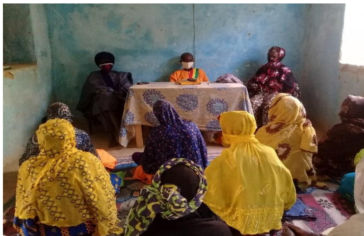
Espace d'interpellation à Banikane