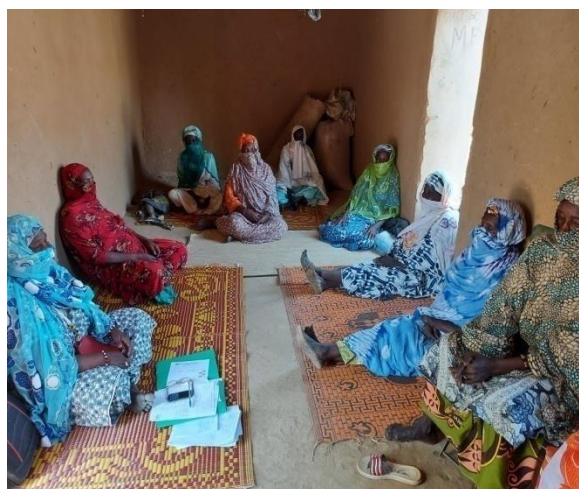
Mise en place groupement à Koura

Au cours de la période janvier-mars 2021 il a été créé dans la région de Tombouctou 190 groupements dont 157 MJT et 33 CJT. Les 190 MJT totalisent 4 137 personnes dont 3 320 femmes, 88 filles, 651 hommes et 78 garçons.