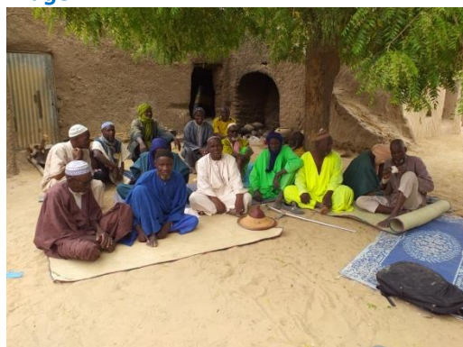
Animation des hommes de Tarfa