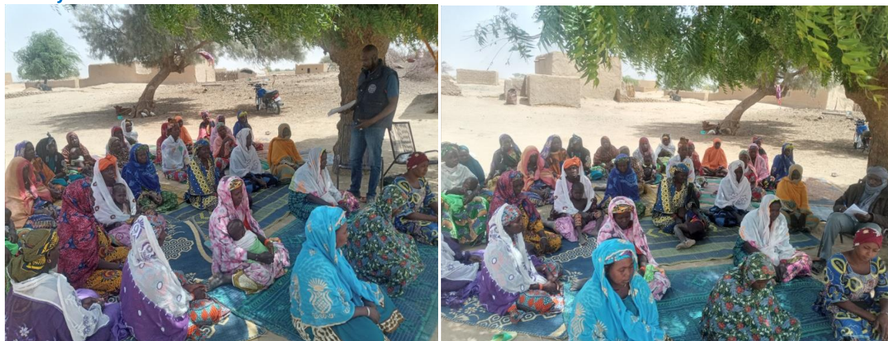
Tableau n° ... : Situation des femmes et filles formées sur les lois et résolutions relatives à leurs droits