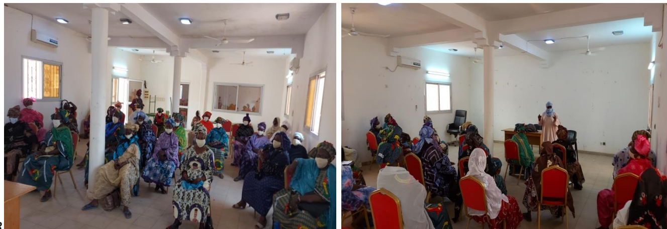
Atelier de formation sur des activités de promotion des droits civiques et politiques des femmes à Goundam

30 femmes ont pris part à cette formation tenue à Goundam.