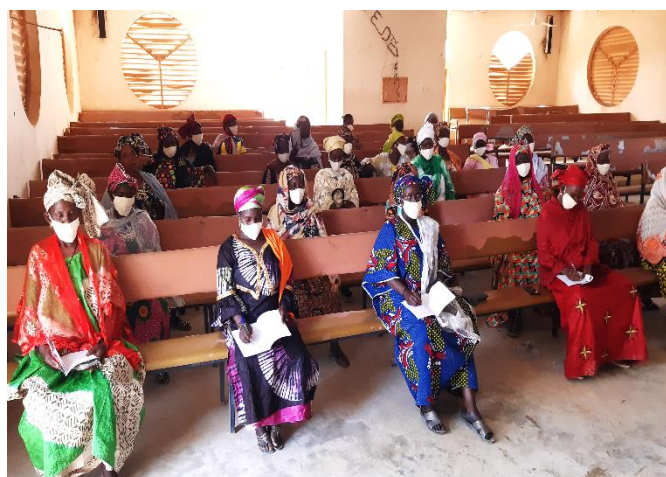
Tableau n°... : Situation des femmes renforcées sur les principes de gouvernance