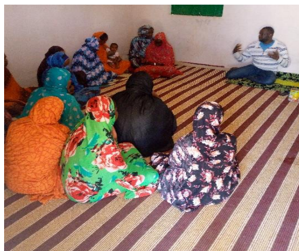
Mise en place de groupement à Tarfa