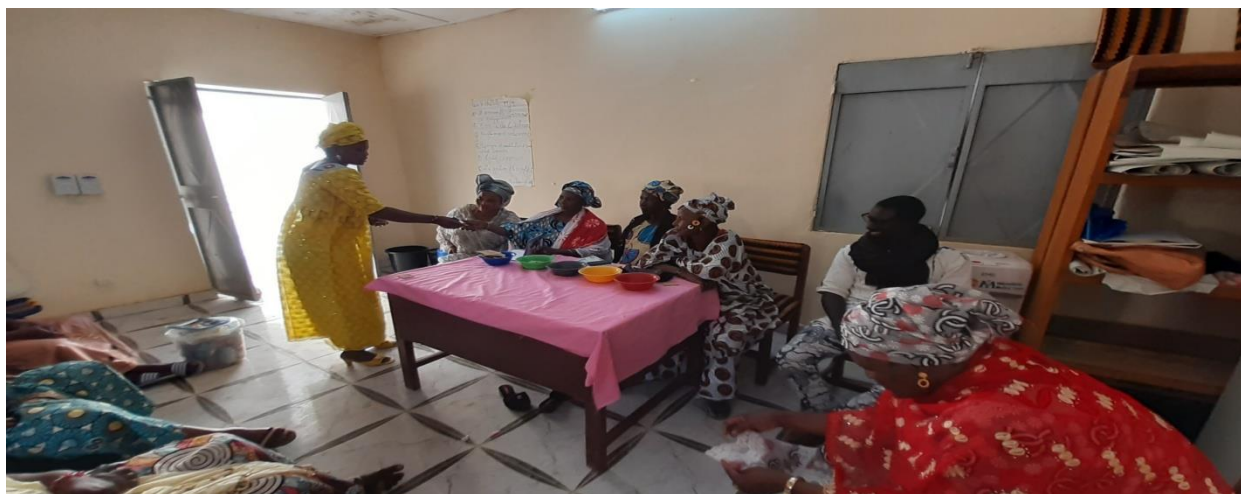
Simulation de collecte d'épargne