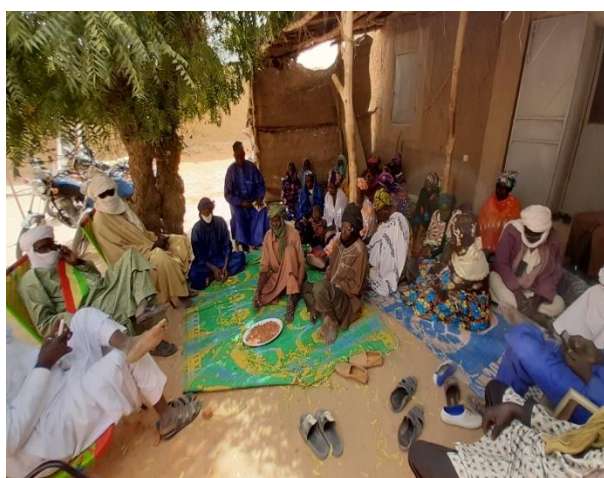
Espace d'interpellation au niveau du village de Tindirma