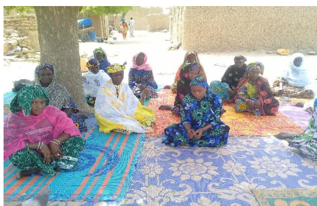
Tableau n° ... : Situation des femmes formées à l'entrepreneuriat