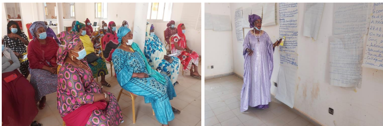
Atelier de formation sur le développement du leadership féminin et aux programmes de talents