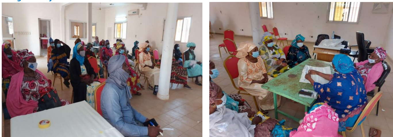
Atelier de formation sur la justice transitionnelle à Goundam