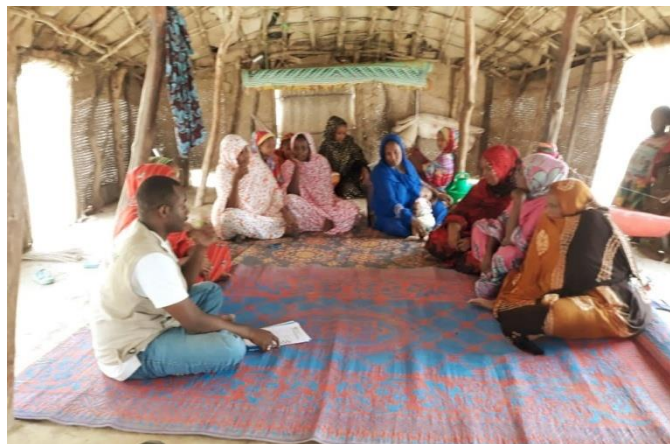
Tableau n° ... : Situation des femmes formées en mobile banking