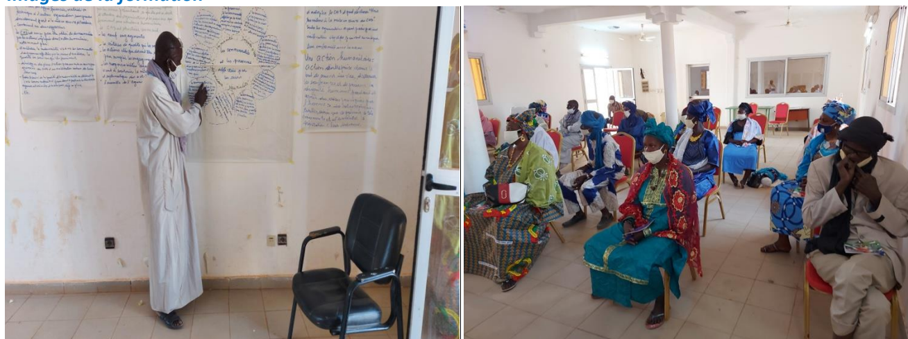
Atelier de formation sur les principes humanitaires à Goundam