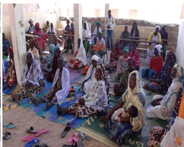
Mise en place réseau villageois de Haibongo