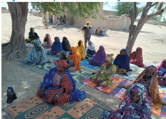
Mise en place réseaux Tissinsick et Ddindjère