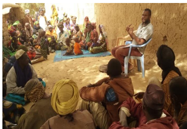
Séances d'animation à Fongo Manacou