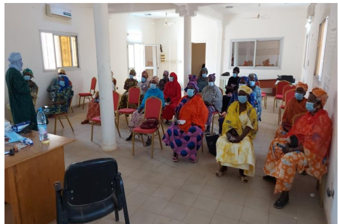
Atelier de formation sur la gestion financière à Goundam