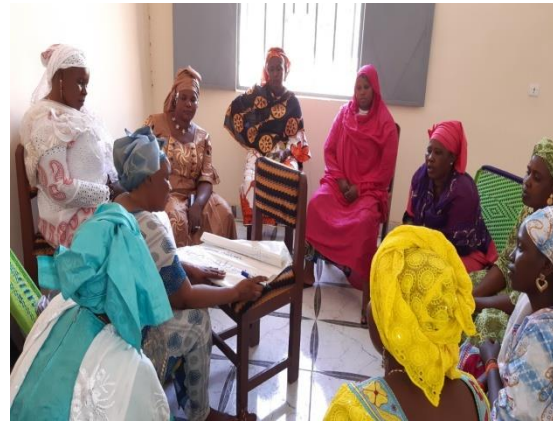
Participants en travaux de groupes