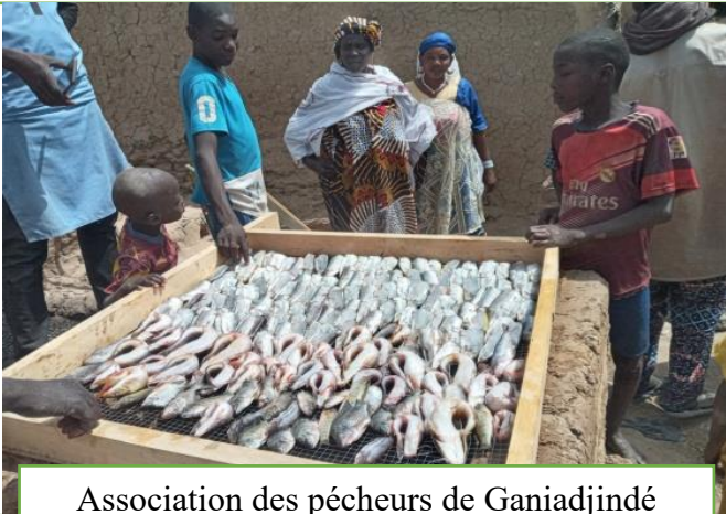
Association des pêcheurs de Ganiadjiné (formation)