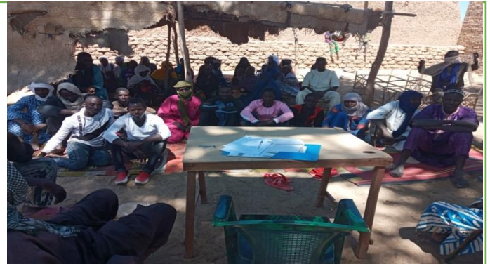
Association des pêcheurs de Ganiadjiné