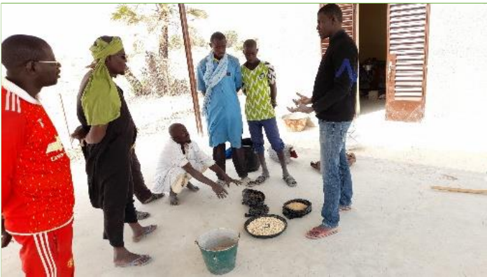
Sareyamou, formation sur les techniques de production d'aliment locaux pour les poissons