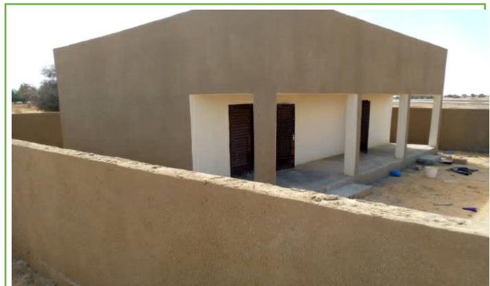
Unité de commerce de riz, DOUTA