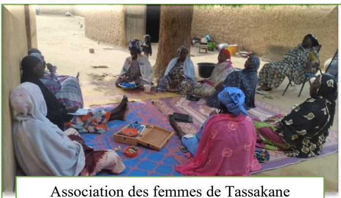
Association des femmes de Tassakane