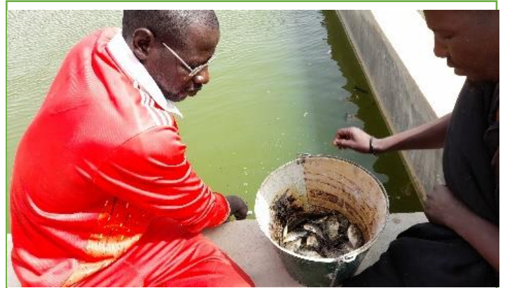
Association Yamou Dicko de Sareyamou Etangs piscicoles