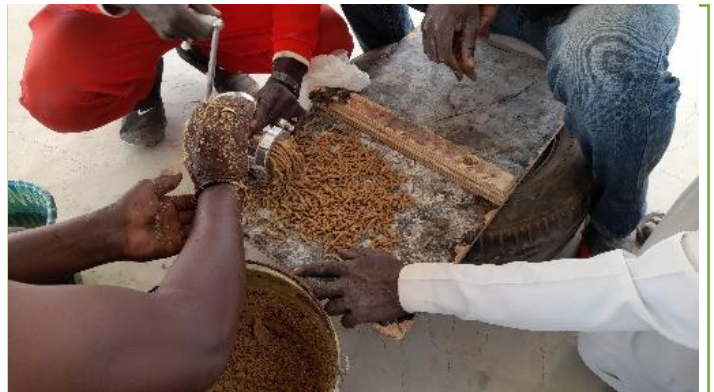
Sareyamou, formation sur les techniques de production d'aliment locales pour les poissons