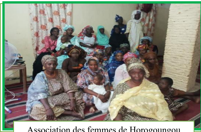
Association des femmes de Horogoungou