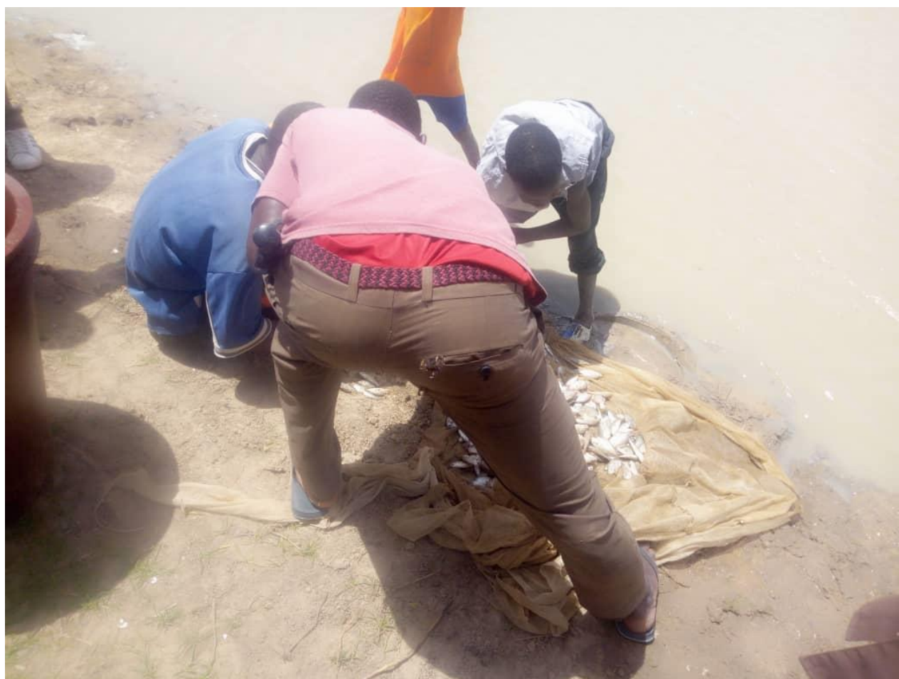
Empoisonnement de la mare de N'ssaba dans la commune de Doukouria