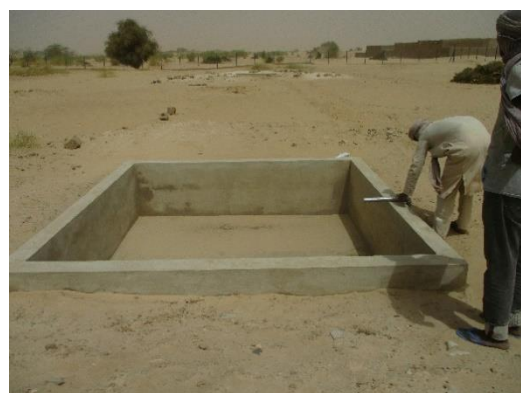
Bassin secondaire/Périmètre maraicher d'Alphahou Taraba