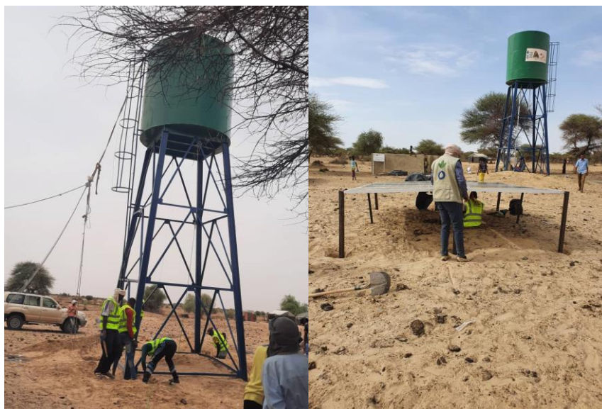
Installation du château d'eau et des panneaux solaires de Daïgoungou (commune de Doukouria)

Ces maintenanciers sont issus des communes de M'Bouna, Gargando, Adarmalane, Doukouria et Bintagoungou. Ils seront formés et équipés par ACF en vue de pouvoir dépanner en cas de problème technique les points d'eau pour assurer la continuité du service de l'eau potable.